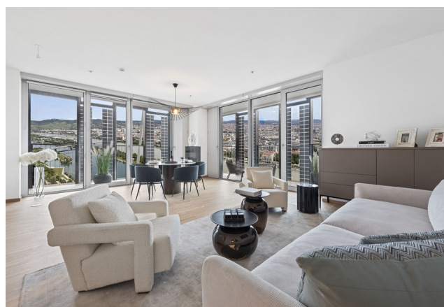
Rendering © S+B Gruppe